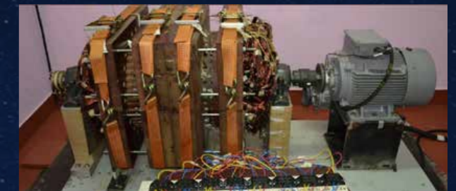
Tewaris Generator: www.tewari.org

Jeder Haushalt könnte mit einem Raumenergiekonverter im Keller seinen eigenen Energiebedarf decken!