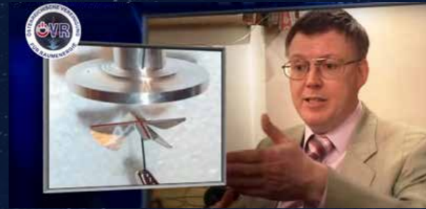
Das Flügelrad Experiment