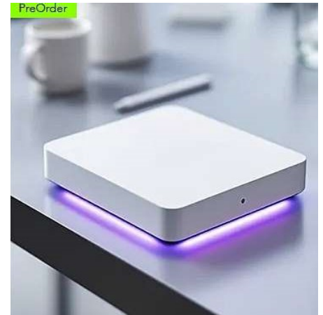
1 SKLep zu 100 W kostet neu 350 Euro.

Klickt man diese Links an, erfährt man folgendes: “Quantum Legacy Foundation und Andrea Rossi arbeiten gemeinsam an der Transformation der globalen Energie: In einer bahnbrechenden Zusammenarbeit,